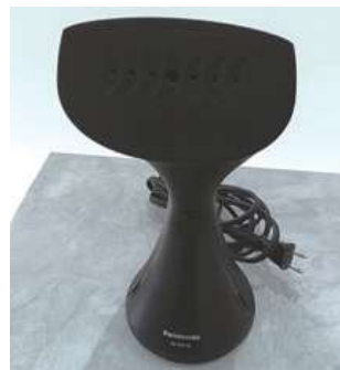
#17 スチーマー ×1