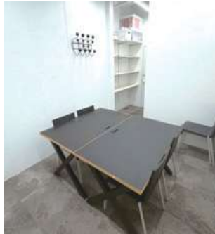
#1 バックヤード② ×1 (試着室として使用可) ¥11,000