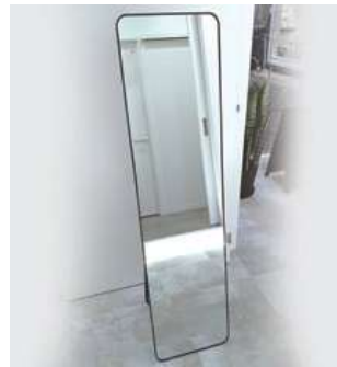
#14 姿見ブラック ×1