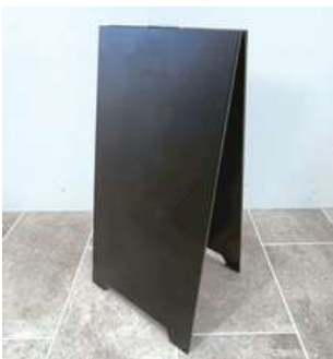
#11 A看板 ×2 W340×H700mm ¥550