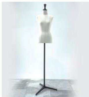
#16 トルソー (ウィメンズ) ×2