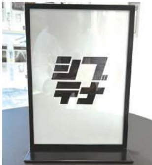
#13 A4サインホルダー 各5個 (ブラック5個、ホワイト5個) ¥550