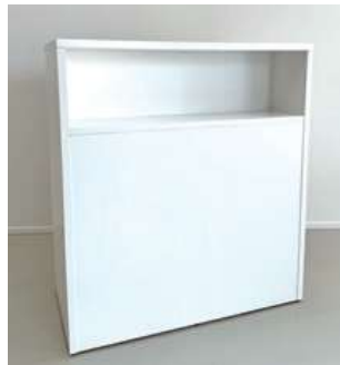
#9 受付カウンター② ×1 W900×D45×H1000mm ¥3,300