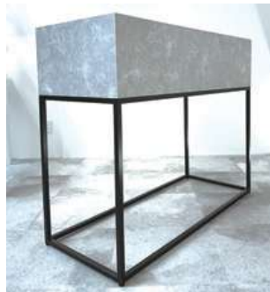
#6 展示台 (大) ×2 W1200×D500×H1000mm ¥2,200