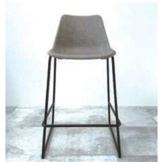
#10 受付用椅子 ×1 座面までの高さH650mm ¥0