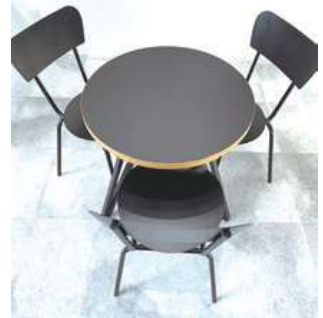
#3 丸テーブルセット ×2 直径700×H700mm ¥2,200