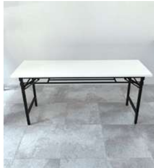
#2 会議テーブル ×4 W1200×D450×H700mm ¥2,200