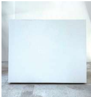
#9 受付カウンター① ×1 W1200×D600×H1000mm ¥3,300