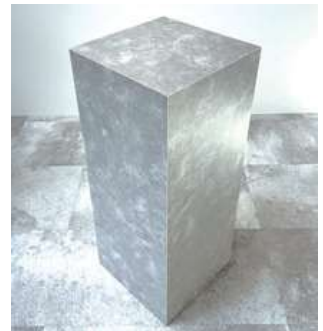
#7 展示台 (小) ×3 W400×D400×H1000mm ¥1,100