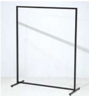
#4 ハンガーラック ×10 W1200×H1500mm ¥1,100