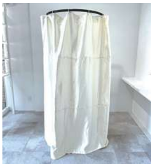
#15 簡易フィッティングルーム ×1 w1100×D1000×H2000mm ¥2,200