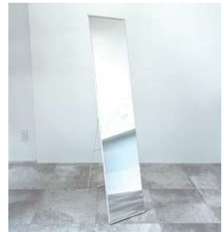
#14 姿見ホワイト ×2