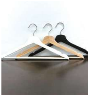
#5 ハンガー (3色) ×各24 ¥0