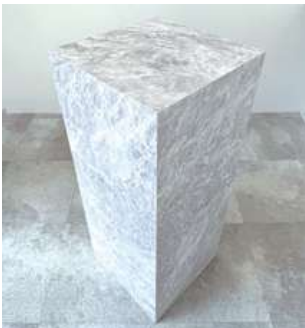
#8 展示台ホワイト (小) ×4 W400×D400×H1000mm ¥1,100