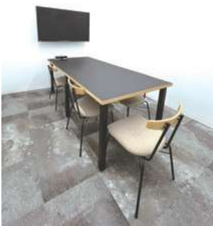
#1 バックヤード① ×1 (試着室として使用可) ¥11,000