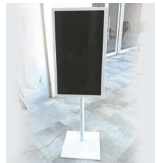
#18 デジタルサイネージ ×1