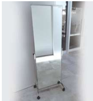
#14 姿見シルバー ×1