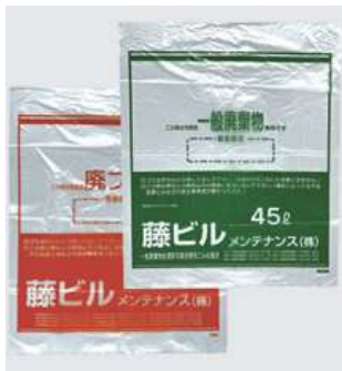
#19 ゴミ袋45ℓ/枚 ×20 (一般事業ゴミ用) (ピン・カン・ペット用) ¥550