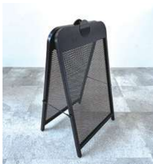
#12 A看板/A2 ×1 W420×D600mm ¥550