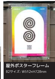
屋外ポスターフレーム B2サイズ: W512×H728mm