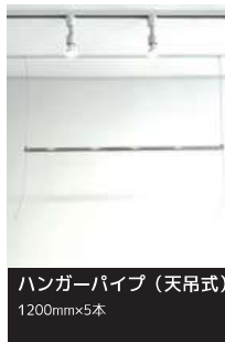
ハンガーパイプ (天吊式) 1200mm×5本