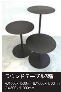
ラウンドテーブル3種 A:φ600×H500mm B:φ600×H700mm C:φ600×H1000mm